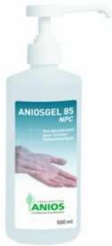
Soluté hydro alcoolique